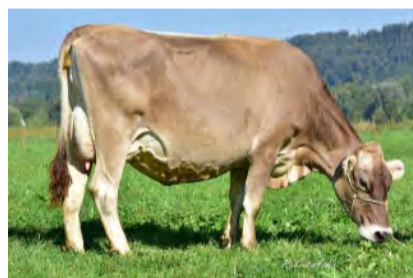
Die Mutter des Stieres Vau: Vinland VERONICA P, in der zweiten Laktation gab Veronica mit < 300 kg Kraftfutter 7600 kg Milch mit 3,96 Prozent Fett und 3,54 Prozent Eiweiss, bei einer durchschnittlichen Zellzahl von 61 000.

Zwei weitere Braunvieh-Stiere, ein SF-Stier und ein Simmentaler Stier kommen in nächster Zeit hinzu. Ausführliche Informationen bieten die Pro-