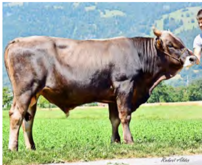
Die beiden neuen Bio-KB-Stiere Faith FINK und Vinland VAU PP (beide BS) während der Aufzucht auf dem Plantahof (GR). Ihre Samendosen werden demnächst bei Swisssenetics über Reservation angeboten. Sie vererben sehr gute Fitnesswerte, wenig Grösse und mittlere Milchleistungen.

Dank einem beharrlich verfolgten Zuchtziel sowie über Jahrzehnte erworbener Erfahrung haben diese Betriebe Kuhfamilien und Herden aufgebaut, die etwas ganz besonders gut